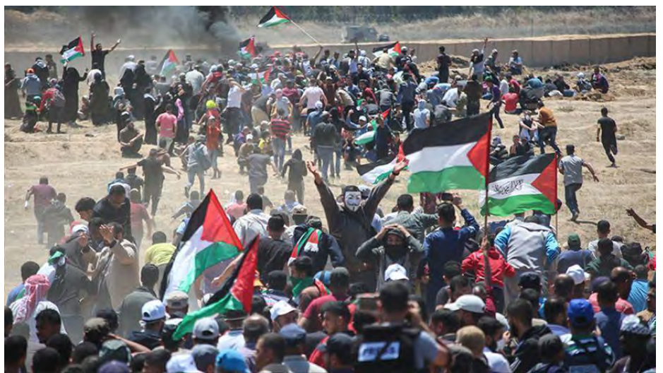
Le 30 mars 2018 débutait dans la bande de Gaza «La Grande marche du retour» contre le blocus exercé par l'État d'Israël. Reconnue tous les vendredis pendant des mois. Plus de 200 Palestiniens ont été tués et des dizaines de milliers blessés, dont beaucoup de jeunes atteints aux jambes restent handicapés à vie, par des tirs et des bombardements israéliens. Sans qu'advienne une solution «juste et durable» à la situation des Gazaouis.

Cette date du 30 mars, la Journée de la Terre, commémore l'assassinat en 1976 par les forces de sécurité israéliennes de six Palestiniens d'Israël qui manifestaient contre l'expropriation de leurs terres par le gouvernement. Ces tirs mortels contre des citoyens non armés démontrent que les Palestiniens vivant à l'intérieur d'Israël étaient soumis aux mêmes mesures répressives létales que ceux des Territoires occupés. Le 30 mars, comme la Nakba et la Naksa, est un jalon important dans la mémoire collective des Palestiniens.