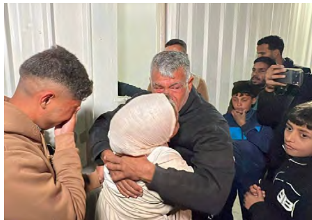
Le 12 février 2026, dans la bande de Gaza, des Palestiniens rentrant d'Égypte sont accueillis à leur arrivée au point de passage de Rafah.