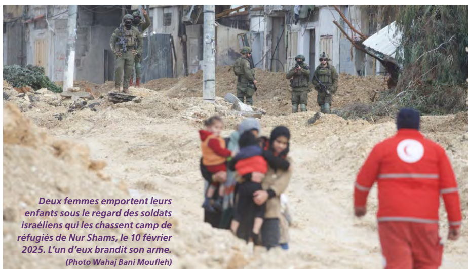
Deux femmes emportent leurs enfants sous le regard des soldats israéliens qui les chassent du camp de réfugiés de Nur Shams, le 10 février 2025. L'un d'eux brandit son arme.

La notion de crime contre l'humanité a été codifiée pour la première fois par le Tribunal de Nuremberg (1945) comme partie du droit coutumier international. Sont ainsi définis les crimes qui « par leur ampleur et leur sauvagerie, par leur grand nombre, ont mis en danger la communauté internationale ou ont choqué la conscience de l'humanité. »