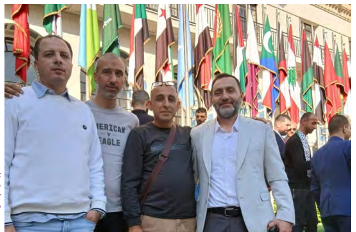
Prisonniers palestiniens libérés exilés en Égypte devant le quartier général de la Ligue arabe au Caire, en décembre 2025.