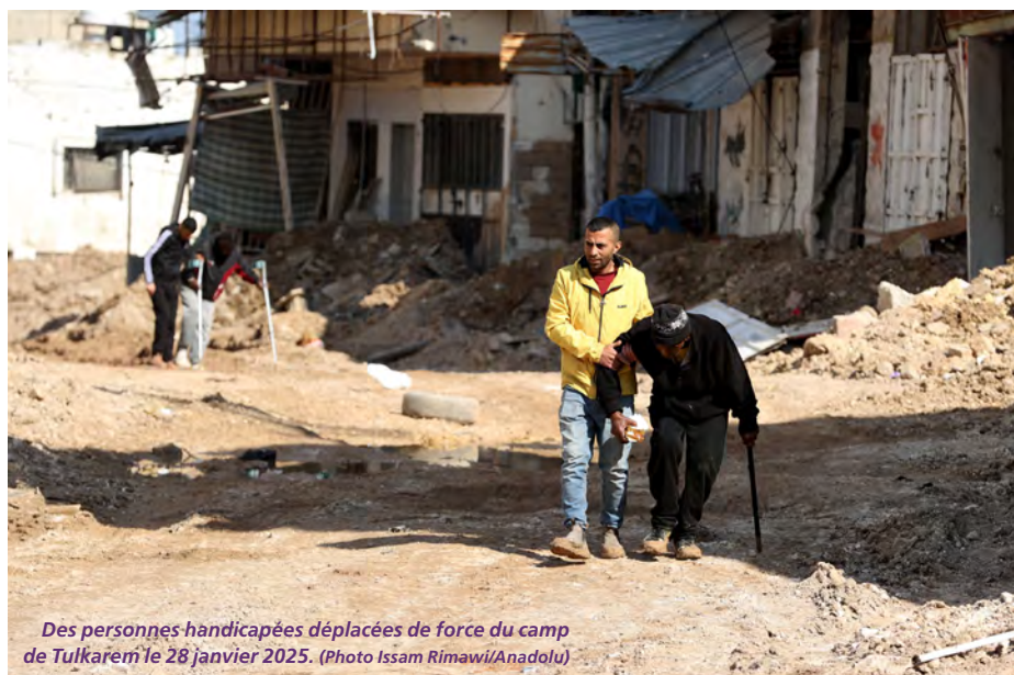
Des personnes handicapées déplacées de force du camp de Tulkarem le 28 janvier 2025.

Pour qualifier les crimes commis par Israël envers les Palestiniens, il est important de se référer à des définitions juridiques qui en assurent la réalité et permettent, le moment venu, de les introduire dans des procédures de juridictions internationales, de poursuivre et d'en condamner les auteurs. C'est dans ce sens qu'un rapport sur les crimes commis par Israël dans trois camps de réfugiés de Cisjordanie, intitulé « All My Dreams Have Been Erased », publié le 20 novembre 2025 par Human Rights Watch, a toute son importance.