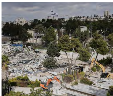
Tractopelles et bulldozers CAT sont arrivés, mardi 20 janvier au petit matin, sans avertissement, au cœur du quartier de Cheikh Jarrah, dans la partie orientale de Jérusalem, pour démolir le siège de l'Unrwa, partiellement détruit puis incendié.