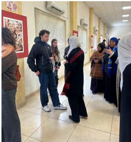
Présentation de la bande dessinée De mémoire de réfugié au camp de Zarqa, en Jordanie, le 12 avril 2025.

Une bande dessinée qui témoigne de la transmission intergénérationnelle de l'identité palestinienne et réaffirme le droit au retour.