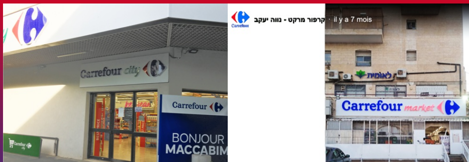
Nouvelles enseignes Carrefour dans le TPO Carrefour City dans le quartier de colonie Maccabim à Modi'in (novembre 2025) et Carrefour Market à Neve Ya'akov (novembre 2024)